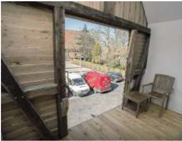
Von Holz umrahmt: Balkone gibt's im Obergeschoss.

In derlei Zeiten ist jedenfalls jedes Bekenntnis zu Stadt und Region Gold wert.