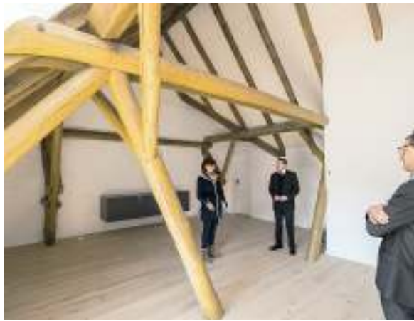
Schlafen unter Holzbalken gehört zum Konzept.